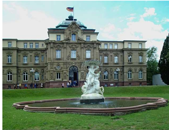
Der Bundesgerichtshof, das höchste deutsche Gericht in Zivil- und Strafsachen, hat seit Oktober 1950 seinen Sitz in dem von Josef Durm 1897 erbauten Palais für den Erbgroßherzog Friedrich. 1944 zerstört, wurde das Gebäude

➤ - третьей и последней инстанцией является Федеральный верховный суд, находящийся в городе Карлсруэ.