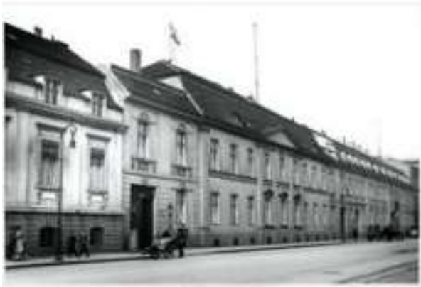
Первое здание, в котором размещалось Императорское Патентное ведомство. Берлин, Вильгельмштрассе 75.

В 1891 году Императорское патентное ведомство переехало в новое здание (на снимке справа).