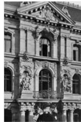
Главный вход в Императорское Патентное ведомство.